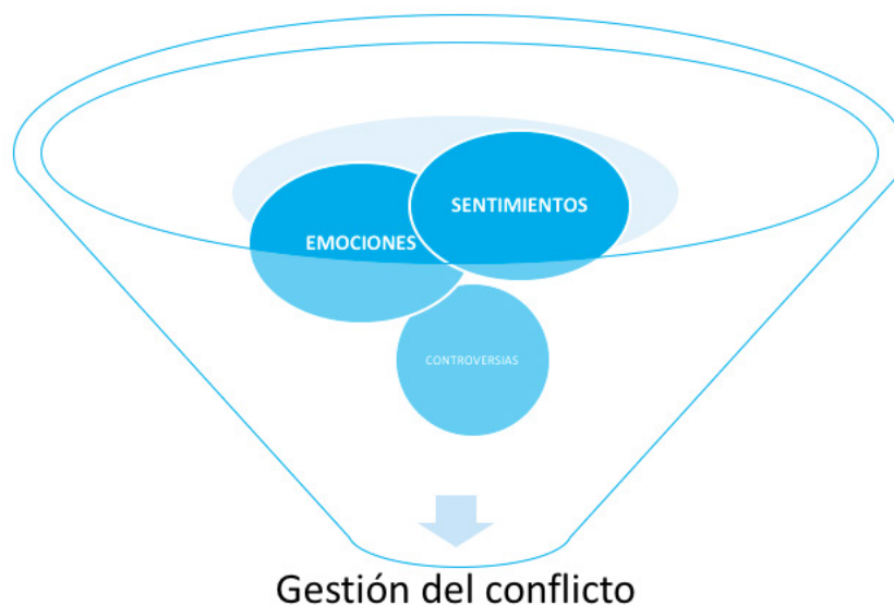
Figura 3. Gestión del conflicto Díaz, P (2018).

Se habrá que dilucidar entre las emociones positivas (alegría, gratitud, admiración, esperanza, interés, amor), las cuales, por lo general favorecen una respuesta hacia la conciliación y colaboración, a diferencia de los estados de ánimo y emociones de carácter negativo (ira, miedo, tristeza, culpa, envidia), que generan con mayor frecuencia comportamientos competitivos y apuntalan estrategias de dominación (Montes et al., 2014). Por ese motivo es importante identificar el efecto de corresponsabilidad entre las causas (origen del conflicto) y consecuencias (momento de mediación penal). Las emociones y los sentimientos se encuentran íntimamente relacionados, ya que ambos incluyen manifestaciones endógenas y exógenas, pero la parte cognitiva se centra en la elaboración de imágenes, experiencias y la evocación del recuerdo, lo cual sostiene y mantiene a la emoción por un periodo más significativo.