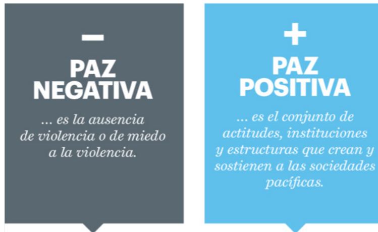
Ilustración 1. Tipos de paz.