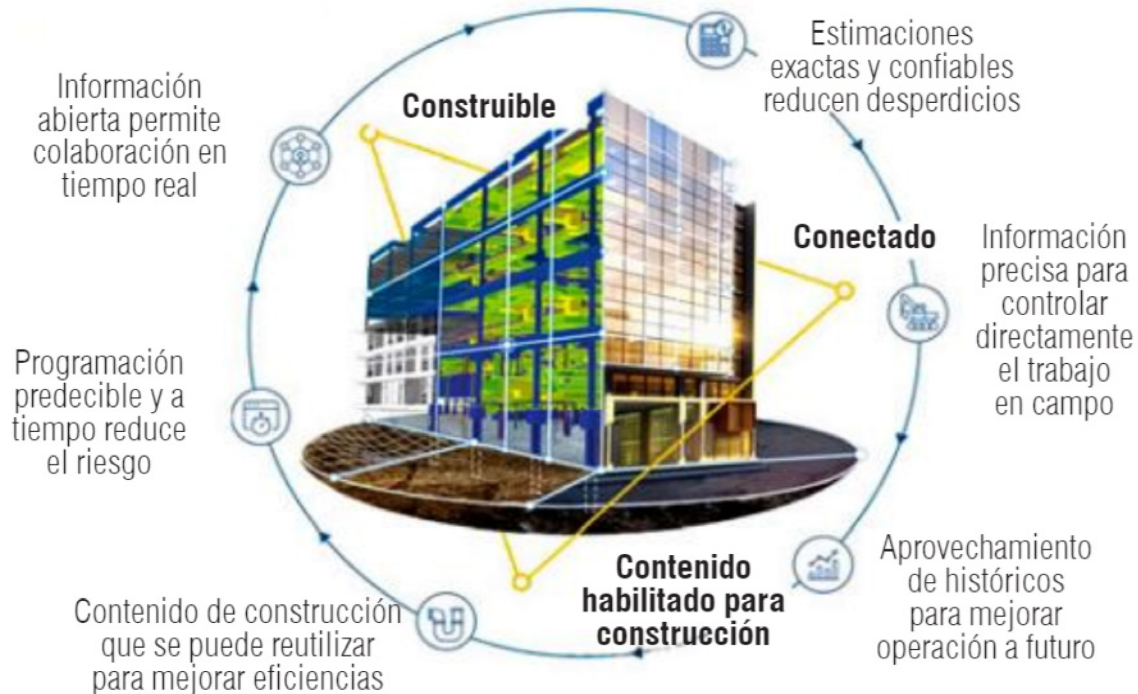
Ilustración 2. Proceso de seguir un buen modelo de proyecto de construcción