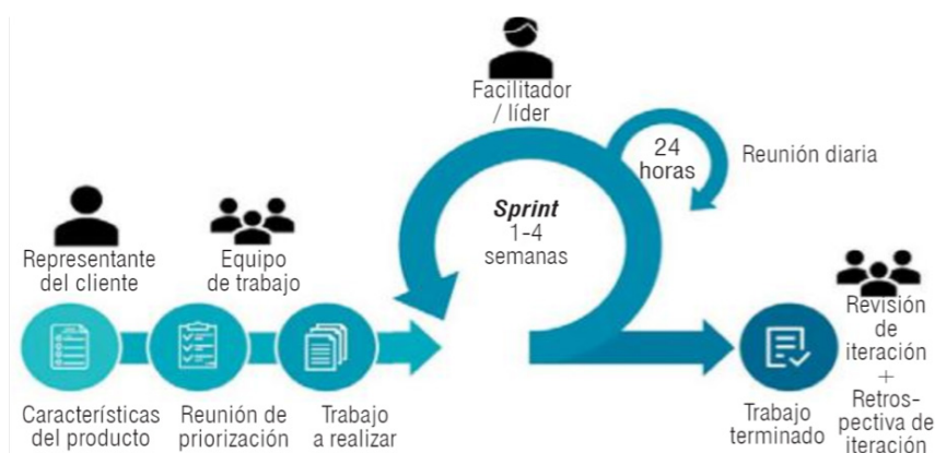
Ilustración 5. Procesos del método Scrum