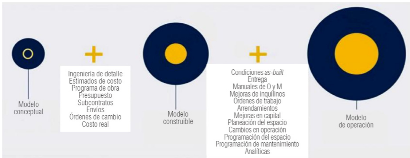
Ilustración 5. Comparación de los modelos conceptuales, construibles y de operación